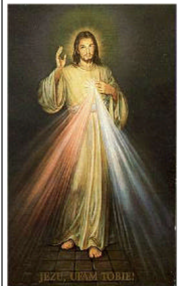
(Jesus, ich vertrau auf Dich)