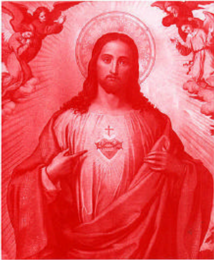
VEREHRUNG DER GÖTTLICHEN VORSEHUNG